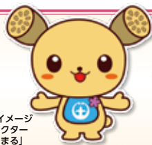
土浦市イメージ キャラクター 「つちまる」