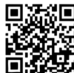
アーカイブ版 QRコード