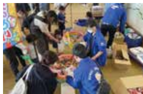
メーデー（お菓子スコップすくいゲーム）