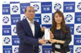
社会福祉協議会への寄付