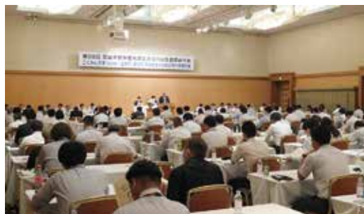
通常総代会の様子

今後もより一層多くの組合員および勤労者のお役に立ち、皆さまから信頼・期待される組織を目指して取り組んでまいります。