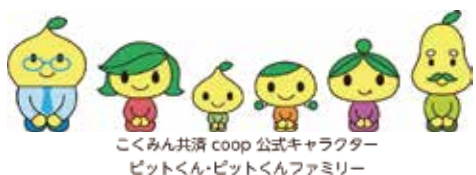
こくみん共済 coop 公式キャラクター ビットくん・ビットくんファミリー

こくみん共済 全国労働者共済生活協同組合連合会 coop 茨城推進本部 (茨城県勤労者共済生活協同組合)