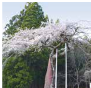
七反のシダレザクラ