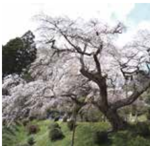
泉福寺のシダレザクラ